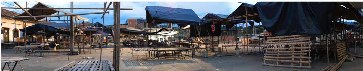
Imagen 02. Producción propia. Piendamó, septiembre 2019.